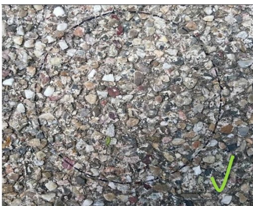
Abbildung 5 Untergrundbeispiel (unterbrechungsfrei)

Die für die Installation der Sensorbasis vorgesehene Fläche sollte weder Fugen noch Versatz aufweisen, um dem Klebstoff einen geschlossenen Untergrund zu bieten (siehe Abb. 4 Freier Parkplatz für Sensor Installation). Dies ist für die Kontaktfläche und die Klebewirkung des Sensors entscheidend.