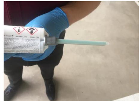
Abbildung 7 Einlegen der Kartusche