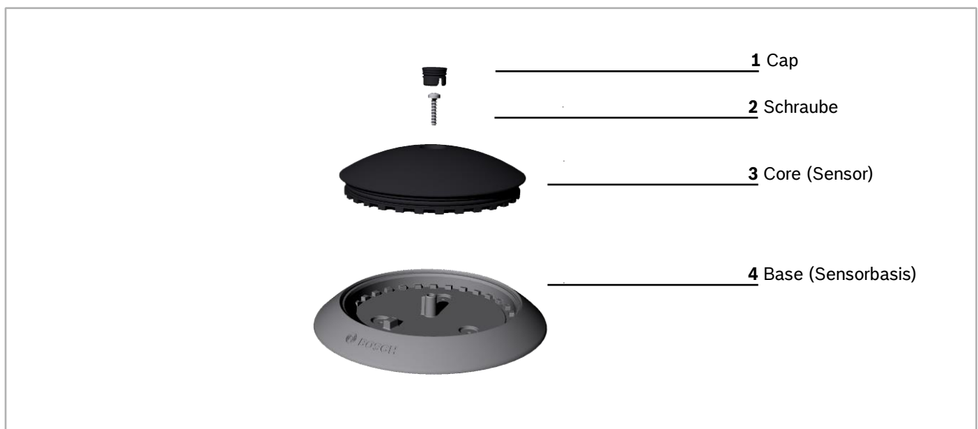
Abbildung 1 Sensor TPS110 EU

Stellen Sie vor der Installation der Sensoren sicher, dass die notwendige Infrastruktur ordnungsgemäß funktioniert – achten Sie darauf, dass die Gateways eingeschaltet sind, eine stabile Internetverbindung besteht und sie sich mit dem Back-End verbunden haben. Das Back-End sowie die zugehörige Management Software müssen funktional sein. Stellen Sie weiter sicher, dass alle benötigten Komponenten (siehe Abb. 1 Sensor TPS110 EU) sowie Werkzeuge bereitliegen.