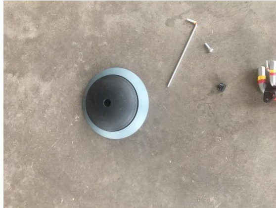
Abbildung 14 Einsetzen/ Verschrauben des Sensors

Der Sensor kann nach Aushärten des Klebstoffes in die Basis eingeschraubt werden. Zur Vereinfachung des Einsetzens zeigt der Pfeil an der Unterseite des Sensors in Richtung des Bosch Ankers (siehe Abb. 14 Einsetzen / Verschrauben des Sensors). Nach Einsetzen des Sensors vergehen ca. 2 Minuten, bis die ersten Messungen durchgeführt werden. In dieser Zeit sollte das Einschrauben abgeschlossen sein, um ein optimales Einlernen des Sensors zu gewährleisten. Zum Festschrauben verwenden Sie die T20 Schraube und verschließen die Öffnung anschließend mit der Sensor Verschlusskappe.