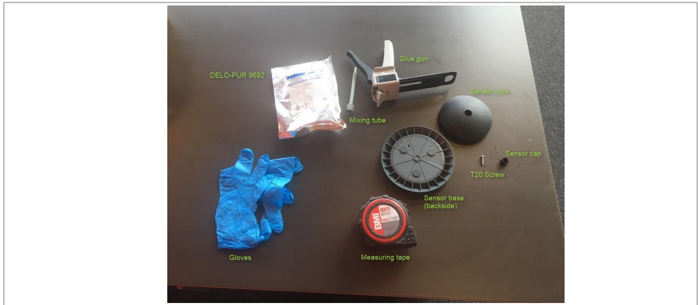
Abbildung 2 Material für Kleben