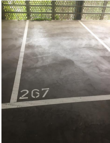
Abbildung 4 Freier Parkplatz für Sensor Installation

Für das Kleben bitte die Vorgaben des Klebstoffherstellers beachten (z.B. Temperatur, Sicherheitshinweise und Arbeitsanweisungen). Eine Parkplatzreinigung sollte zuvor mit dem Parkplatzbetreiber abgeklärt werden, so dass keine Ablösung von vorhandenen Beschichtungen durch die Behandlung verursacht wird.