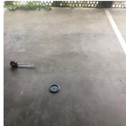
Abbildung 12 Sensorbasis Aufbringung