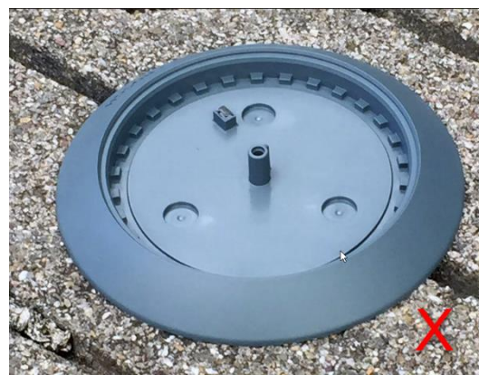
Abbildung 6 Untergrundbeispiel (Fuge)