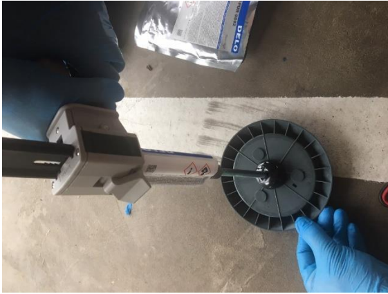
Abbildung 10 Klebstoffaufbringung