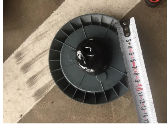
Abbildung 11 Klebstoffmenge

Bitte beachten Sie, dass der Klebstoff innerhalb weniger Minuten aushärtet, sobald die zwei Komponenten vermisch werden.